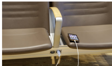
Charging option on Transeat in OSL